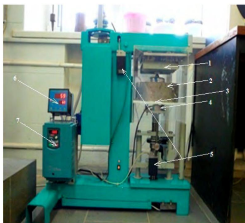
Рис. 1. Общий вид лабораторной установки для оценки устойчивости дорожно-строительных материалов на накопление остаточных деформаций под воздействием динамических нагрузок: 1 — инфракрасные нагреватели; 2 — образец испытываемого материала в обойме для обеспечения бокового обжатия; 3 — подъемный стол; 4 — датчик силы; 5 — оптико-электронные растровые преобразователи линейных перемещений; 6 — температурный регулятор; 7 — частотный регулятор

Далее проводились экспериментальные исследования укрепленных образцов из ЩПС на воздействие динамических нагрузок такой частоты и времени воздействия, которые были бы максимально приближены к реальным условиям эксплуатации дороги. Испытания проводились на лабораторном оборудовании под воздействием кратковременно повторяющейся расчетной циклической нагрузки (рис. 1). На лабораторное оборудование получено положительное решение о выдаче патента на полезную модель от 29 августа 2011 г. [8].