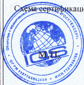
Схема сертификации: Ic